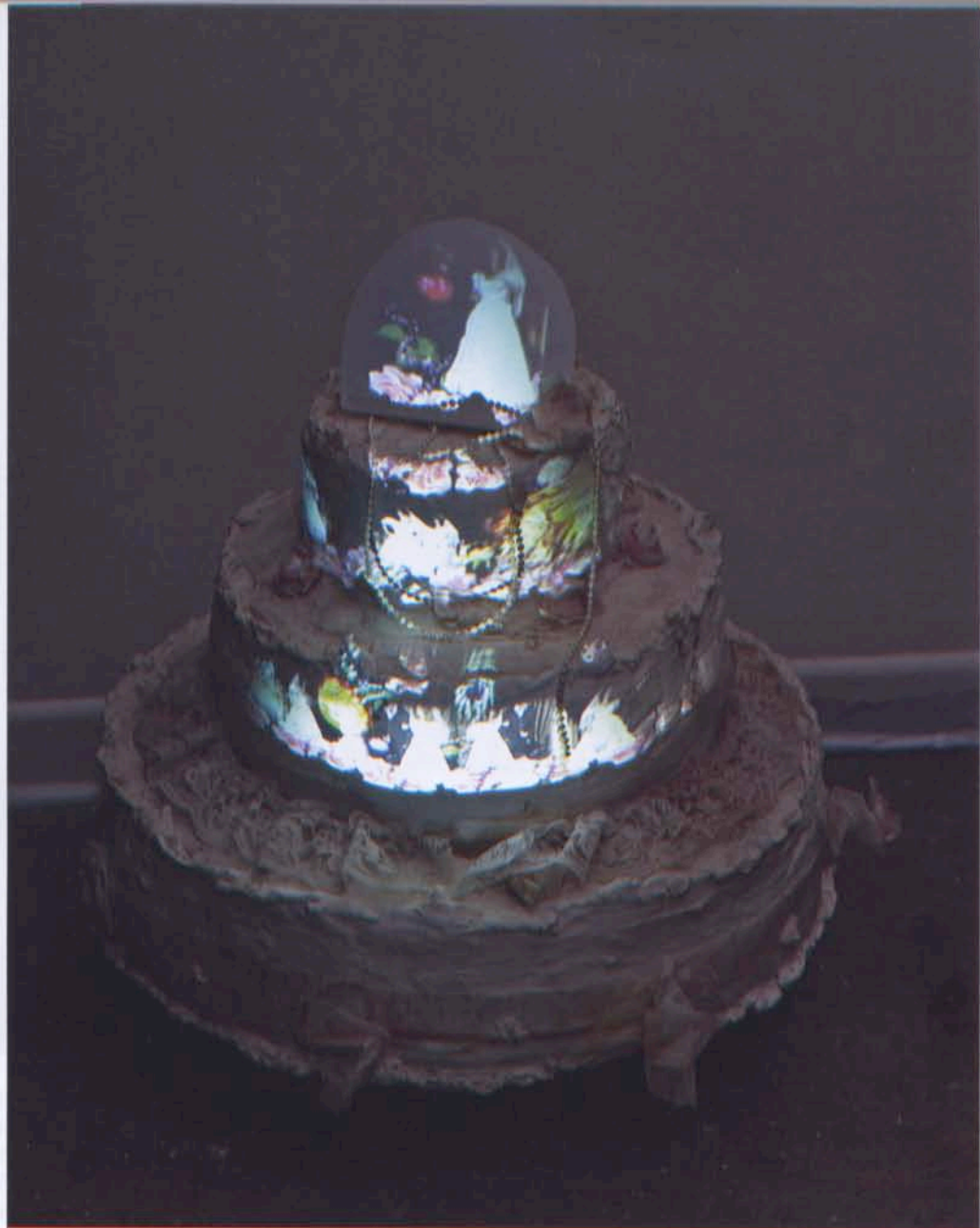
Eugénie Cliche, Le gâteau gâté .